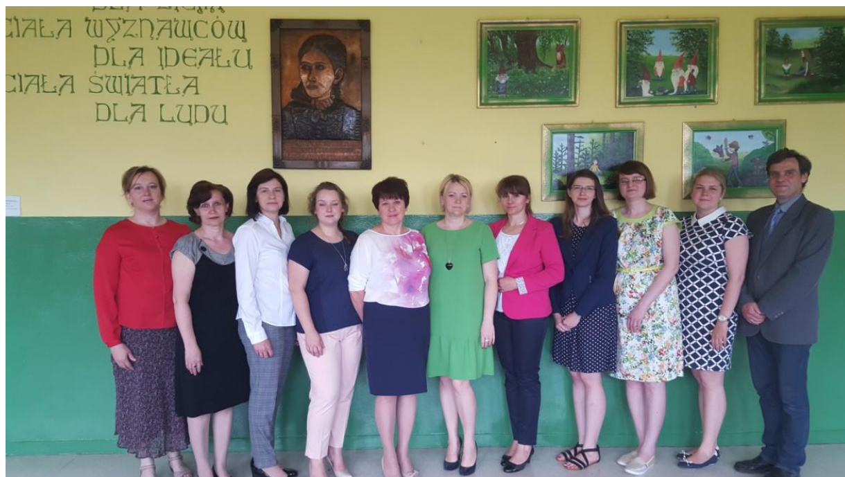
Grono nauczycieli w 2016 roku