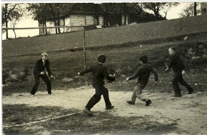
Zajęcia na boisku sportowym