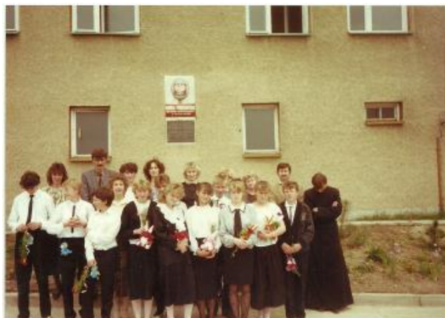
Zakończenie ósmej klasy w 1990 roku